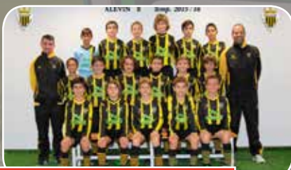
U.D. Balsas Picarral