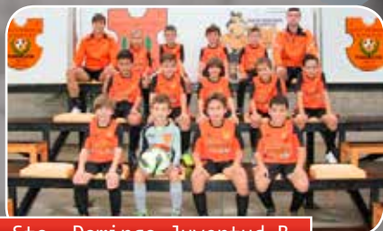
Sto. Domingo Juventud B