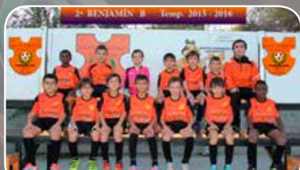
Sto. Domingo Juventud D