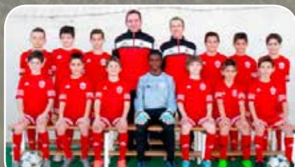
C.D. San Gregorio