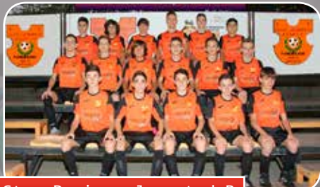
Sto. Domingo Juventud B