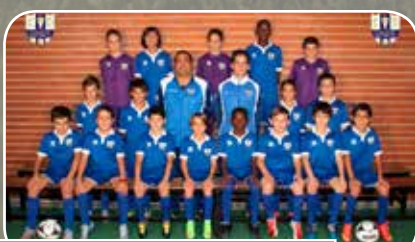
C.D. Giner Torrero