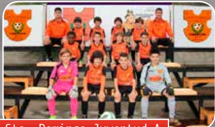
Sto. Domingo Juventud A