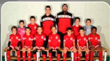
C.D. San Gregorio