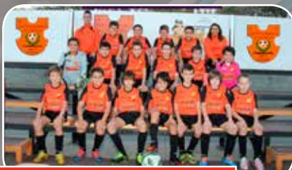
Sto. Domingo Juventud C