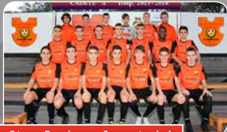
Sto. Domingo Juventud A