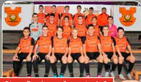
Sto. Domingo Juventud C