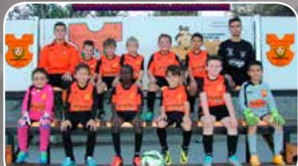
Sto. Domingo Juventud C