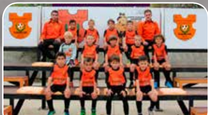
Sto. Domingo Juventud A