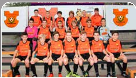
Sto. Domingo Juventud B