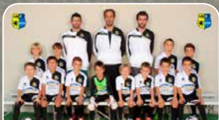
Unión La Jota Vadorrey