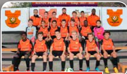
Sto. Domingo Juventud A