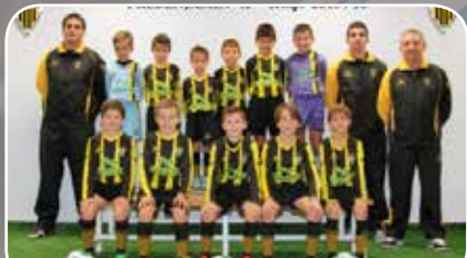
U.D. Balsas Picarral