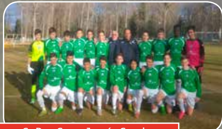
C.D. San José Soria