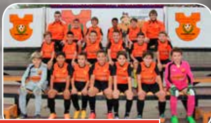
Sto. Domingo Juventud B