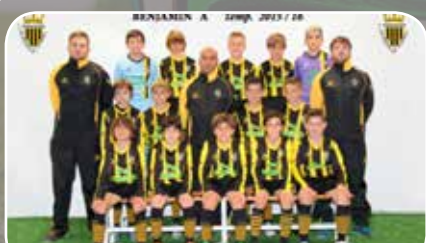
U.D. Balsas Picarral