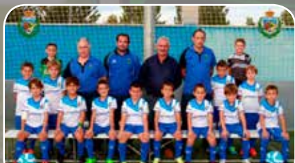
R.S.D. Santa Isabel