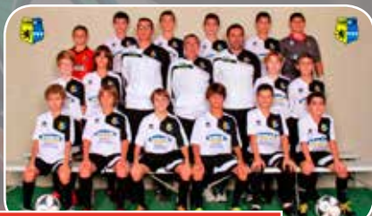
Unión La Jota Vadorrey