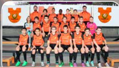
Sto. Domingo Juventud C