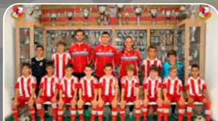
C.D. Actur Pablo Iglesias