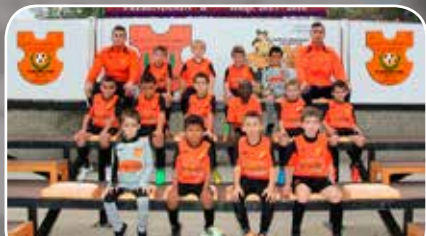
Sto. Domingo Juventud B